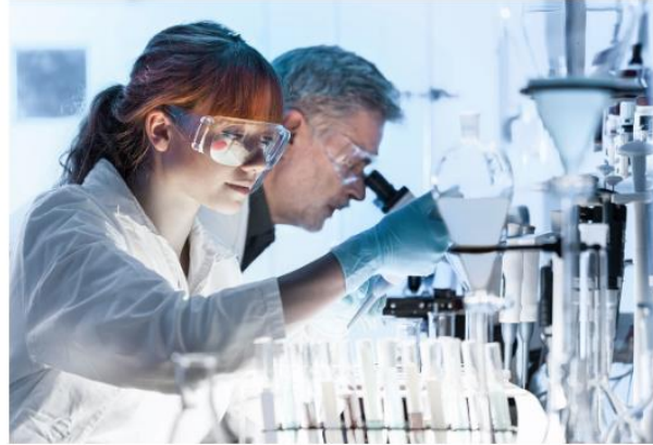
Biology and Life Sciences